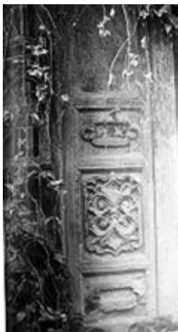
图3 《景德镇祥集弄11号门框》