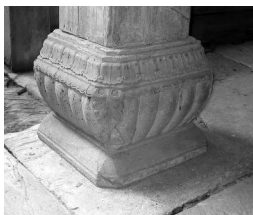
图4 《景德镇通议大夫祠石柱础》