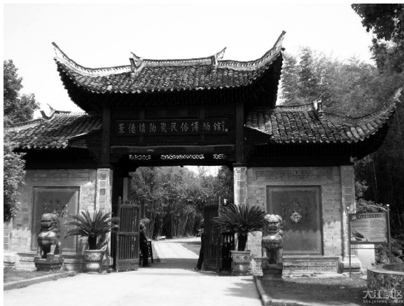
图10 《景德镇民俗博览区门口石狮》

古徽州文风昌盛、教育发达，提倡“以才入仕、以文垂世”，为宣扬封建伦理道德多采用“立牌坊”的形式来传显荣光。此外，明清时期的徽商称雄商界，明《五杂俎》云：“商贾之称雄者，江南首推徽州，江北则推山右(山西)”徽商贾而好儒，而且重视教育，有较好的文化素养。他们在家乡大兴土木，兴建豪宅、祠堂、寺庙等，这些古建筑，风格独特，布局合理，装饰精致，变化自然，具有乡土气息。加之徽州盛产木材，民间向有雕刻、绘画传统，砖、