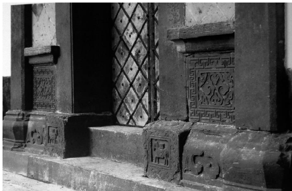
图1 《江西景德镇祥集弄11号须弥座墙裙及地袱》

特点二,借鉴山水画的形式。江西建筑石刻中的部分构图在形式上借鉴山水画的构图,重视空白的布局,以树、石、山等题材为主体布局于中间,有些四边还刻有图案纹饰进行装饰。如图2《婺源汪口大夫第门楼》,此门楼的墙基雕有风景和花卉。图中墙基的上部俨然一幅风景画,图中采用中国画中的散点式构图,画面中间布置于松树和两只小鹿作为主体,一只小鹿做奔走状,一只停着似观察动静,采用高浮雕的雕刻形式更加的突出于画面,而画面