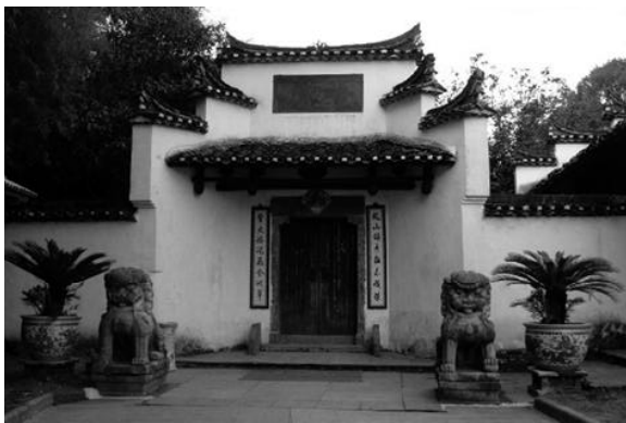
图 11 《古窑门口石狮》