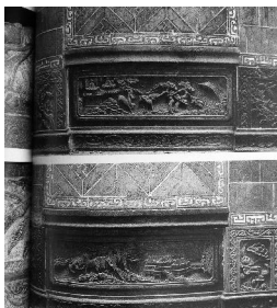
图2 《婺源汪口大夫第门楼》