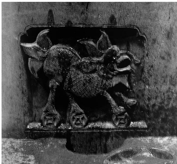
图7 《婺源思口延村余庆堂天井地袱》

江西东北部的建筑石刻艺术中体现出明显的佛教题材,我们知道佛教的传入给中国建筑石刻艺术的发展提供了丰富的土