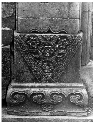
图9 《婺源思口延村余庆堂大门贴墙柱础》