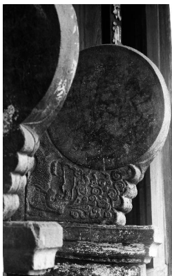
图8 《婺源江湾大宗祠堂五凤楼前抱鼓石》