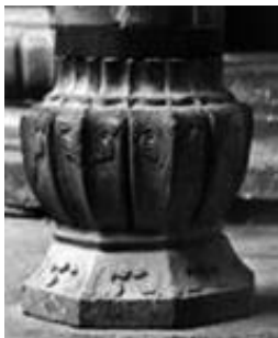
图6 《王氏宗祠石柱础》

的左边有一前一后两亭子,为了表现出亭子的前后虚实关系,两亭子雕刻的手法也有区别,前面亭子刻的精细突出,后面亭子概括简练,也比较浅。画面右边采用俯视的形式雕刻一小桥,为了不至于左重右轻在桥的周围刻画有波浪线表现出水纹的流动。鹿和水纹使整个画面有了灵气。