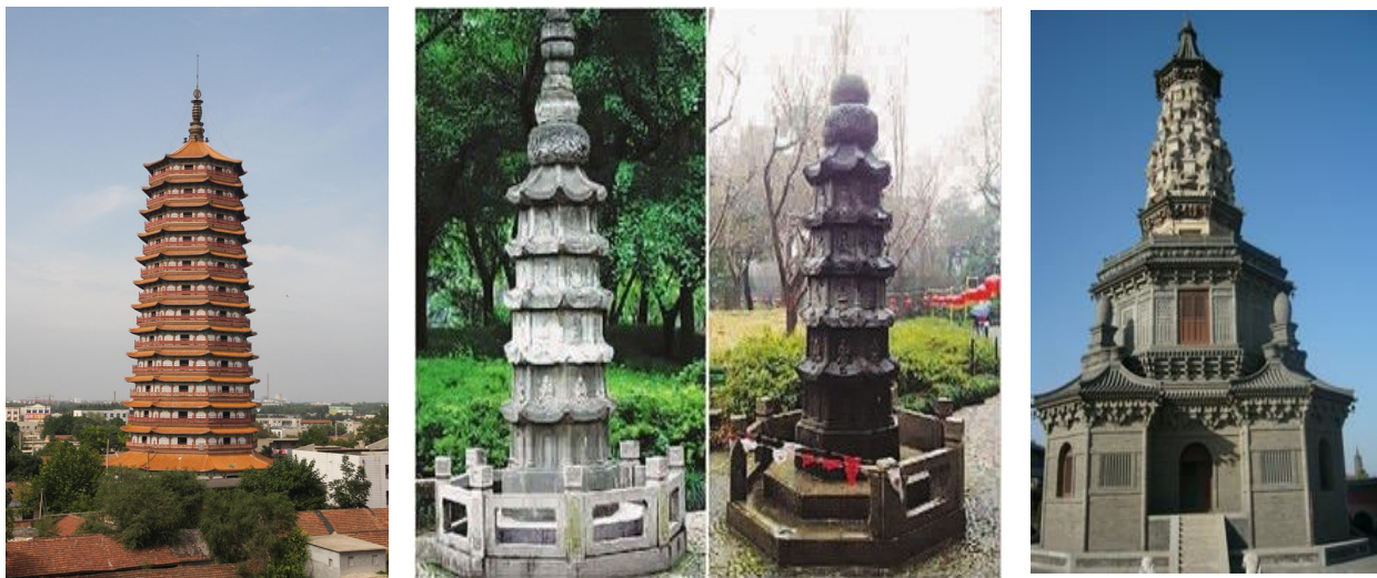
图二 中国古塔样式

塔是中国古代建筑类型中出现较晚的一种类型，但作为一个异国情调的建筑与中国传统建筑结合的非常完美（图二）。塔起先在印度之时与中国后来随处可见的塔还是有很大的不同的，印度的佛塔，在印度称为“窣堵波”的这种建筑形式，其外形本只是一个半圆形的墓冢，但是随着佛教而传入中原之后，便与中国原有的各种建筑形式相结合，其结构趋于复杂，主