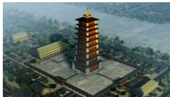
图三 永宁寺布局鸟瞰复原图

此对于永宁寺的记载，明确的说明了永宁寺的布局，（图三）而寺的平面布局则继承了中国传统的坊里建筑形式，而后，随着念经的殿堂的主体地位的提