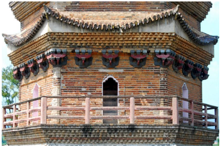
图十五 赣南古塔细部结构

的一座塔。明代崇祯年间赣南修建的惟一座石塔是定南的巽塔，是用花岗岩砌筑的高 17 米的五级塔。这些塔有的高峻雄伟，有的奇丽玲珑，有的稳重特立，有的端庄古朴，并且结构布局独具风格，拥有地方特色，（图十五）充分表现出古代赣南客家先民的超群聪明智慧以及高超的建筑水准。