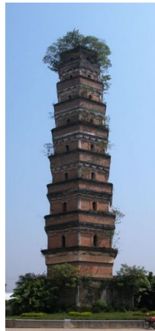
图二十 长满植物的塔身

风的传播会带来许多的尘土依附在塔上,伴随尘土而来的植物的种子也会随之依附在塔身之上,阳光雨水的浇筑之下,于是那些种子最终生长在塔身之上。(图二十)除此之外,会有一些在塔上栖息的鸟类残留下来的食物残渣和粪便在塔上,给塔上生长的植物提供了生长所需要的肥料养分,进一步促生了塔上植物的数量,塔生植