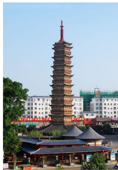
图十一 信丰大圣寺塔

信丰大圣寺塔，（图十一）塔高五十米，砖木混石结构塔。建于北宋年间。九层六面，高 66.25 米，原有副阶周匝，设斗拱，平座，倚柱，额枋等枋木构件。有明暗层之分，底层三面有门，另相间的三面砌以假门，气势不凡。观其建筑技艺高超在其它古塔之上。