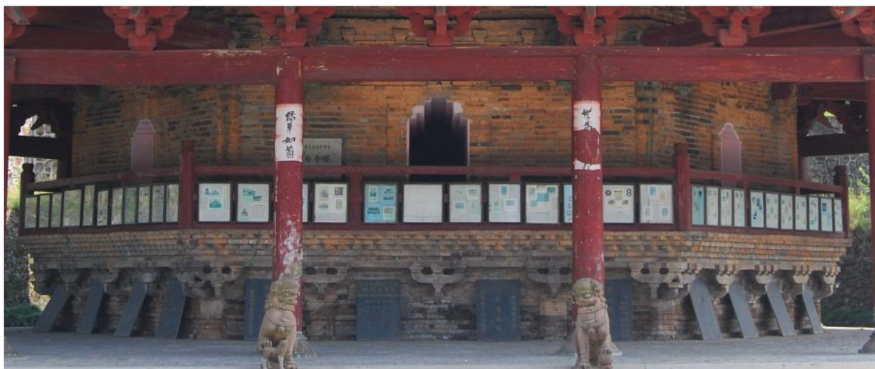
图十六 赣南古塔副阶和基座

的结构特征，然其内部结构都安排相当之合理，符合力学的规律，具有一定的科学性。明代的塔内部结构基本上属于壁内折上式，而清代的塔多为空筒式塔，除此以外还有内部是实心结构的，有的塔其内部是全部封闭的以及通心式的塔，这些结构样式的出现缘由大部分都是因为后期塔的建造只是为了用来做风水不足的弥补功效，其主要功能并不是用来做游览之用。现存的赣南古塔当中，实心的塔的数量并不多，只有金星塔、文塔以及瑞金的文峰塔这几座，以石质材料来构筑的塔身，通体袖长，带有浓厚的地域文化特色以及时代特征。而在清代大肆使用的空筒式结构的塔其原型是仿造唐塔的建筑构造，整个塔身建筑采用砖材构筑，内里的各个楼层以及楼梯等均采用木材，赣南大余的嘉佑寺塔就是典型的空筒式结构的塔。而所谓的通心式塔，指的是塔结构其外观是有分层的，但是内面直壁到顶端，内部结构当中的中间是不使用梁板进行分割楼层，有的塔建筑即使内部有分层构筑，但是这样的塔的内层是不与塔的外观一致，内层是完全起到增强的壁之间的纽带作用，没有登上观光的目的。