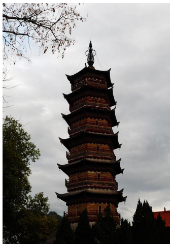
图十三 石城宝福院塔

位于石城的宝福院塔，（图十三）也是北宋古塔之一。这座宝塔坐落于县城东南边的宝福院后面，与琴江河紧靠相邻，二者组成的塔影江心被称为是古代琴江八景之一。此塔的建造