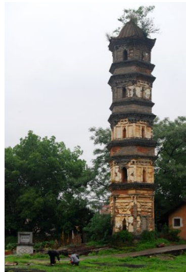
图十二 大余嘉佑寺塔

外，这座塔不高，整个塔高十九米，塔的表层是青灰色的，所以放置于周围建筑之中，不怎么显眼，很容易被忽略这座塔的存在。仔细观察这座塔，此塔和《滕王阁对客挥毫图》里面描绘的一些古代建筑风格相似，具有唐代建筑的风格，但是有学者考究，其虽有唐之风格，但是还是一座不成熟的宋塔。（图十二）整座嘉佑寺塔塔身结构精巧，端庄，稳重。塔身每级每个面都设有券门、柱、枋子以及斗拱，每一层的下面部位的均有直立拱顶的券门式佛龕，塔身中空，有出挑的塔檐，沿着塔壁佛龕抵达至顶层。佛龕内原来应该有佛像，但是如今都已经不知所踪，徒留空空的佛龕。在塔的二层到五层可以看到每层都有突出的双层花檐，砖砌而成，上层的坡顶是倒钟形覆瓦坡顶，高度约为 1.5 米，样式精巧。