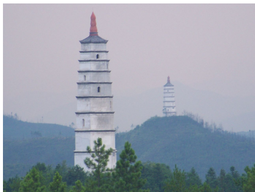
图七 瑞金南山三塔

观念的影响，构筑在山峦峰巅的文峰塔将具有人文社会功能，建造在城镇周边江河的水口处的水口塔则是具有生财敛财聚财功能的。但是，有的风水塔由于地理位置相对比较特殊，其同时会兼有两种塔的双重社会功能。另外，有些地处于城市的水口位置的寺院，寺院里面的佛塔便也处在城市的水口位置，该佛塔除却宗教功能以外，其本身也是具有镇守水口的社会功能的，所以后来，人们也会把这种类型的佛塔诠释成为具有风水塔性质的水口塔，比如赣州安远县的无为寺塔以及大余县的嘉祐寺塔就是这种类型的。