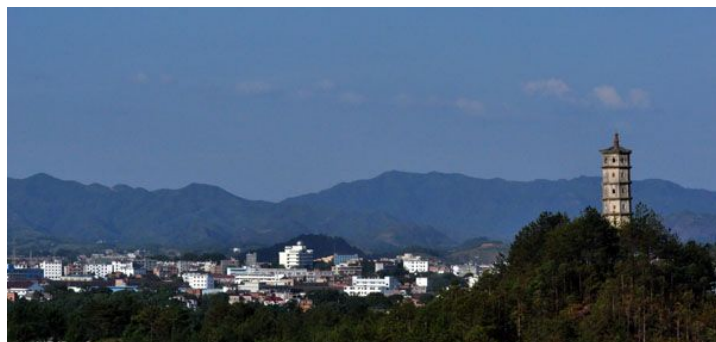
图十八 兴国朱华宝塔

兴国县的朱华宝塔就是一座极具代表性的风水塔。根据史料记载，该塔的建造是“补缺障空，大光官曜”，（图十八）兴国《朱华塔记》云，自横石和西山塔毁后，“潏水为輶，江流不平，俗尚悍讦，士好逸游，民逃业荒，沙图并里，迄于今日，气习益漓，文命不振，都无完里者十三，里无完甲者十九，不