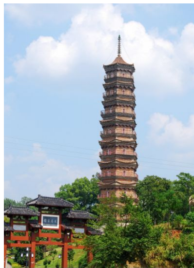
图九 安远无为寺塔

江西许多古塔建造位置往往和地理环境结缘，赣南地处山林，此处多有寺庙，故塔亦处处可见。赣县有一座唐穆宗时期建的大宝光塔，此塔座落宝华山寺内，为僧人大觉禅师建，塔七层，外型雕塑美观，塔顶为大理石垒砌，后因朝代更易，大宝光塔时建时废，现存的大宝光塔据史载为宋时宝塔。赣南安远县城西门外原大兴寺后，可见一座北宋天圣二年建的无为