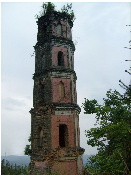
图十四 龙南关西塔

文塔，建塔于清朝顺治年间，现位于龙南县城郊桃江五鬼山上，属于实心的砖结构塔。这是一座高 8 米的六角三层的楼阁式塔。底部开有一个门洞，塔上上面是阴刻的“文峰”两字，塔顶为一个椎体，由灰浆卵石堆积而成，像是一个还没有竣工的古塔建筑。