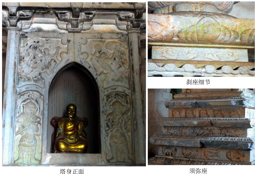
图十七 大宝光寺塔细部结构

一座墓塔，又称为普通塔、和尚塔。这是一座内塔，这种塔的结构相对简单，其规模也比较小。该塔的建造于宗教是有关联的，其建筑装饰与佛教建筑有相似之处，大多采用与宗教有关的装饰纹样。例如在塔身上浮雕形态各异的狮子，麒麟，凤凰以及卷云纹等装饰纹样，同时雕刻着各式盘膝跌坐的菩萨等等装饰纹样，（图十七）极具宗教意义。墓塔是高僧圆寂之后的一种纪念性建筑，内里或放置高僧骨灰，遗物之类的物什，以供佛教信徒的参拜。