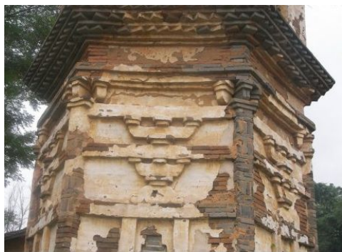
图十九 大余县嘉佑寺塔剥落的塔身

中国古建筑的历史被誉为是“木头的历史”,由此可知中国大多的传统建筑都是以木头作为原材料建造而成的,而作为中国建筑的一部分的古塔建筑,也多是以木为材而起的建筑,之后才出现木砖结构以及砖石结构的塔建筑。