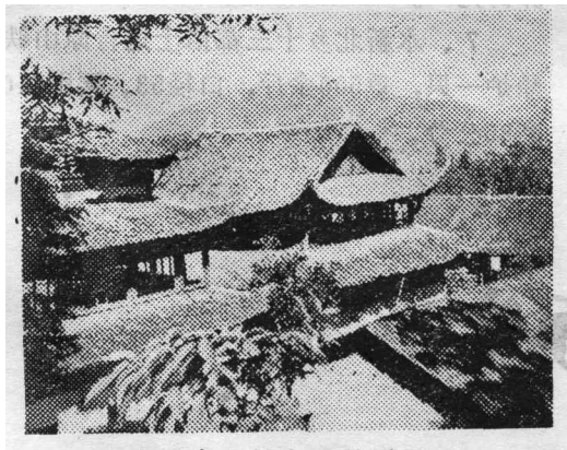
净居寺大雄宝殿外景

1、《祖关》石刻碑。“祖关”二字唐代大书法家颜真卿公元767年为青原山净居寺山门所题，《祖关》石刻碑嵌在山门牌坊上，立于通往净居寺的路口，相传到寺中朝拜的人，见了“祖关”，“文官要下轿，武官要下马”，然后徒步进去，以示虔敬。文化大革命中，牌坊被毁，“祖关”二字的石刻碑被当地社员群众抬到生产队仓库里保存下来了，此乃青原山“墨迹四宝”之最。